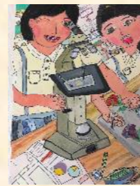
はるか画伯 「顕微鏡をのぞきこむ私」