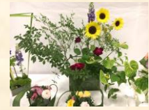
高2年 女子作 「フラワーアレンジメント」