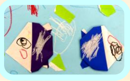
5歳 男児作 「おさかな」