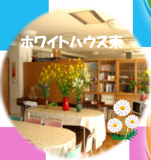
ホワイトハウス東