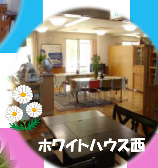
ホワイトハウス西