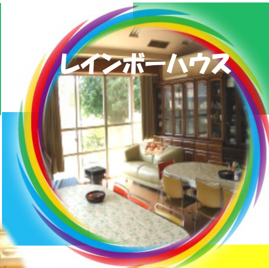
レインボーハウス