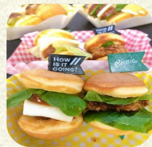
ミニハンバーガー