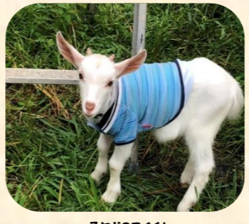
~子やぎのロイくん~

するとどうでしょう、首が折れてだめと言われた子やぎが声に誘われたのか、首をもたげ鳴こうとしています。子ども達もびっくり「頑張れ、頑張れ」と励まします。しばらくすると立ち上がるようになります。やぎ飼いのおじさんも、これはと思い、人工のお乳を口に入れてくれました。子やぎは見違えたように泣き出し、立ち上がるかと何度も何度も。大丈夫かもしれない。子ども達もヤッターと大喜び、これから人工乳で頑張る事を職員に懇願し、連れ帰ることにしました。それからは、人間の親子のように風呂に入れたり、昼夜、頻繁にミルクを交代で飲ませ、お尻を拭いたり、睡眠不足になりながらもお部屋で育てています。子やぎも女の子を母親だと思っているようです。