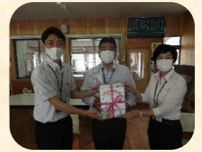
九州ろうきん様 (図書寄贈)