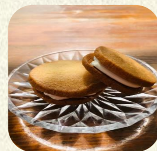
クリームサンドクッキー