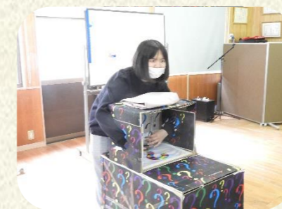
GW企画 箱の中身はなんだろう?