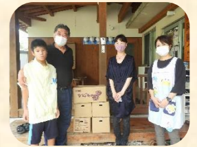
株式会社スマイルクリエイト様 (かぼちゃ寄贈)