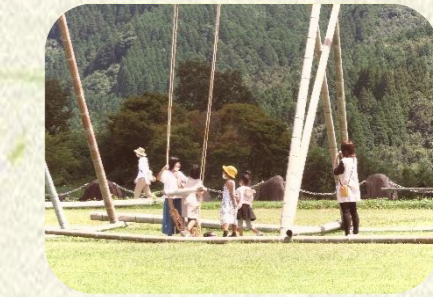
竜門ダムピクニック